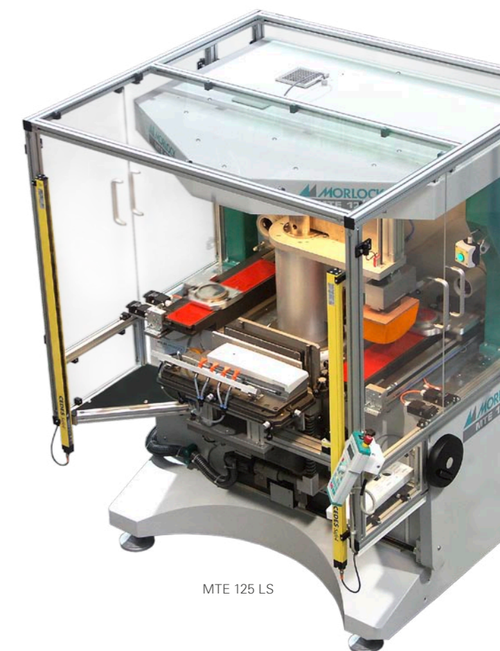
MTE 125 LS

Comme toutes les machines de la MTE-série de 125 MTE LS dispose d'un réglage en hauteur de table, un ajustement des clichés (Réglages en X.Y et angulaire) et un ajustement de la puissance d'impression.